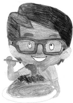
Illustrazione a cura di Nicoll

Molti alunni non sono soddisfatti del servizio mensa della scuola. Per questo motivo il 15 novembre alcuni alunni della scuola secondaria di primo grado hanno partecipato a un'assemblea con la capocuoca e alcuni insegnanti per discutere dei problemi del servizio e cercare di risolverli.