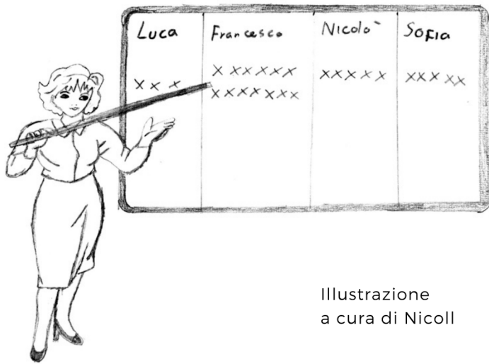
Illustrazione a cura di Nicoll

Una delle responsabilità è quella di mandare i compiti e ciò che è stato fatto durante la giornata ai compagni che sono stati assenti. Oltre ai compiti si devono comunicare anche eventuali cambiamenti nell'orario oppure anche assenze dei professori.